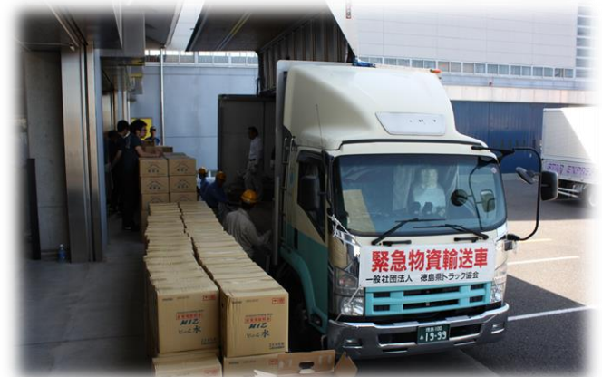
緊急支援物資を輸送車に積込む様子

今年4月の熊本地震の際、輸送協定に基づく県からの要請や市町村等からの輸送依頼により、延べ8回にわたって支援物資の輸送を行いました。