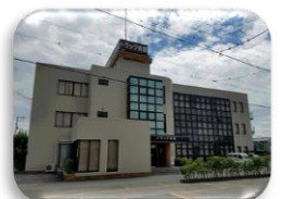
徳島県トラック協会