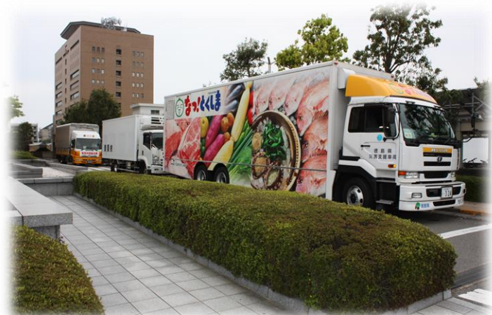
新鮮なっ！とくしま号と一緒に緊急支援物資を輸送するトラック

支援物資は、東日本大震災の際に得られた教訓を生かし、被災地において不足している飲料水のほか、アルファ米、缶詰、レトルト食品、カンパン、粉ミルク等の食料や医薬品、紙おむつ等が提供され、時間の経過と共に変化する被災地のニーズを考慮しながら輸送が行われました。