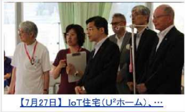
【7月27日】IoT住宅(U 2 ホーム)、…

【8月2日】「地盤改良工事の施工不良等の問題に関する有識者委員会」中間報告書を土井副大臣が受領