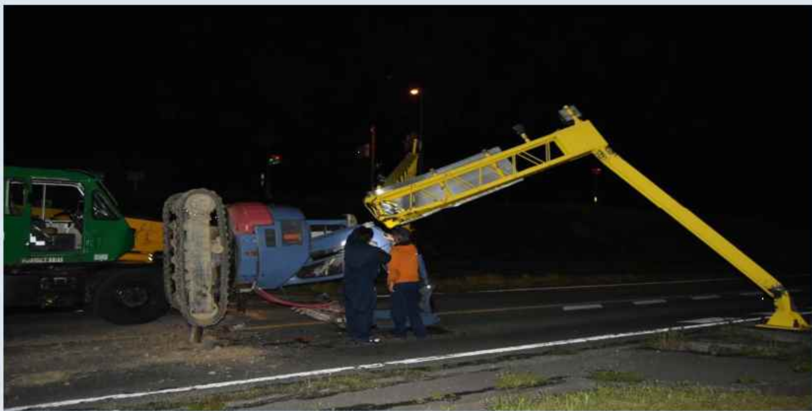
南詰アンダーパス事故(令和5年4月12日)