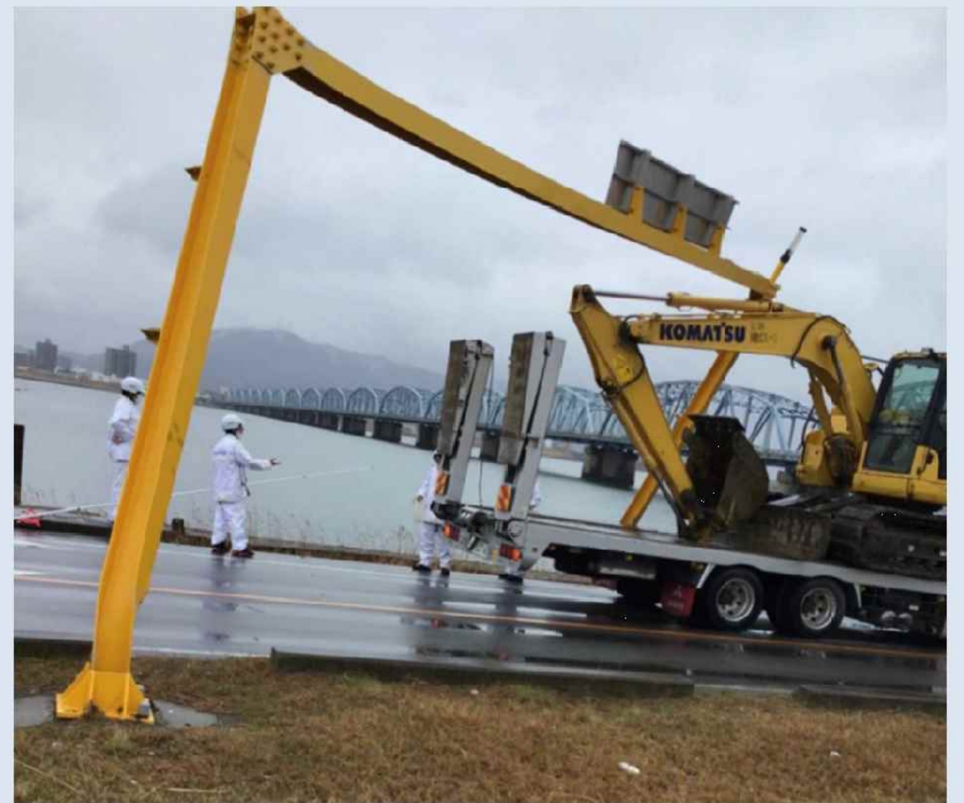
北詰アンダーパス事故(令和3年2月26日)