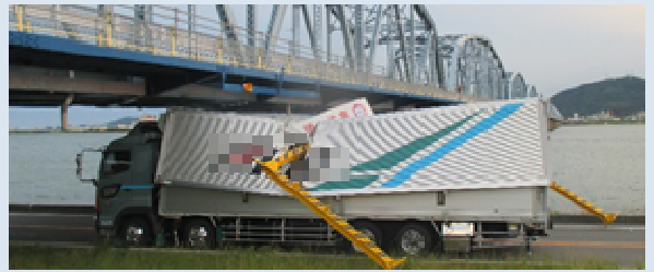
北詰アンダーパス事故(令和元年6月3日)