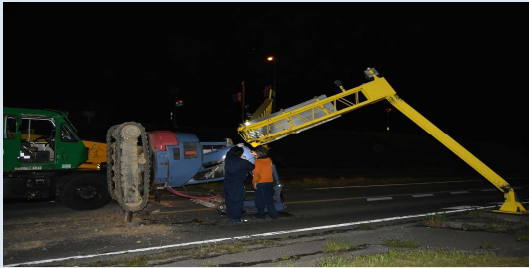
南詰アンダーパス事故(令和5年4月12日)